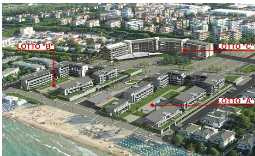
Piano di Lottizzazione approvato: Veduta aerea da Nord-Est

Nel rispetto di quanto previsto dal Piano di Lottizzazione di cui alla Convenzione