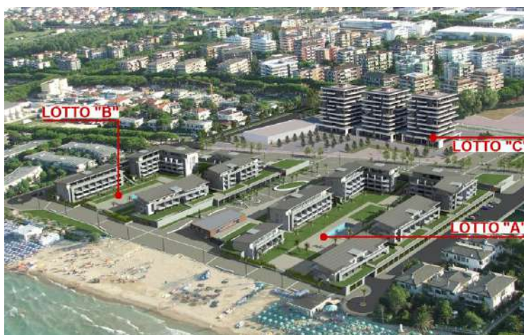
Progetto di Variante al Piano di Lottizzazione: Veduta aerea da Nord-Est

Il progetto si inserisce pienamente nel contesto urbano esistente, adattandosi pienamente alle previsioni del Piano di Lottizzazione già approvato e convenzionato.