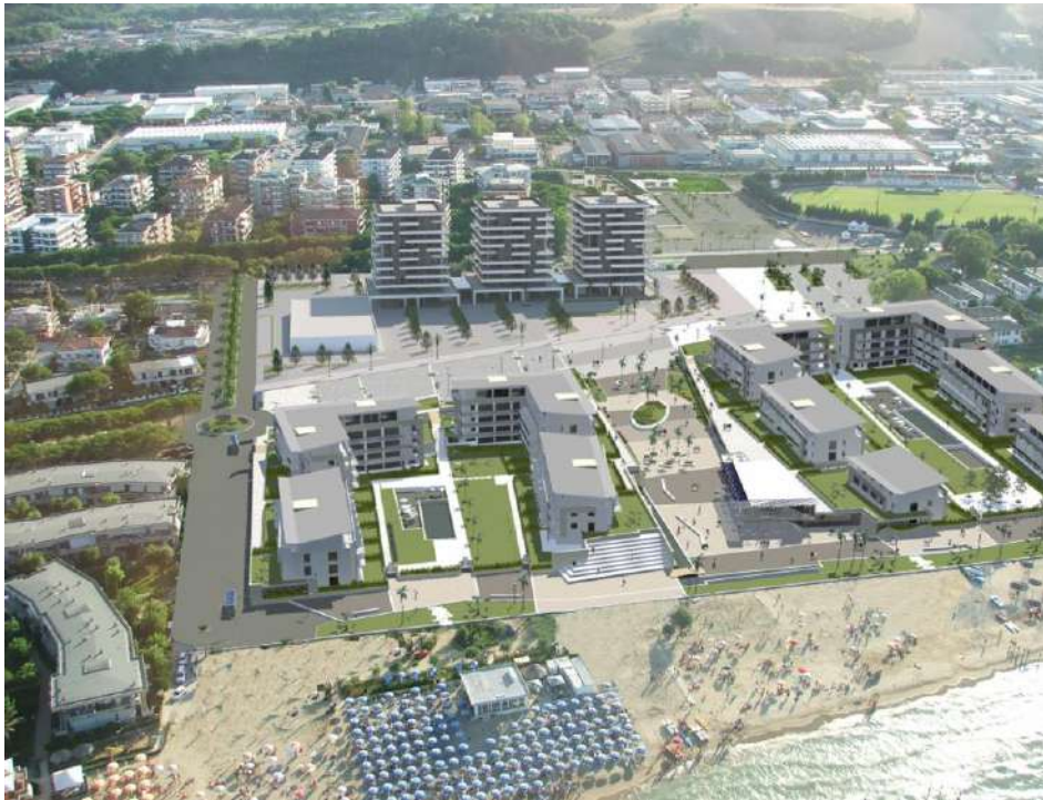
RENDERING: Veduta aerea da Est