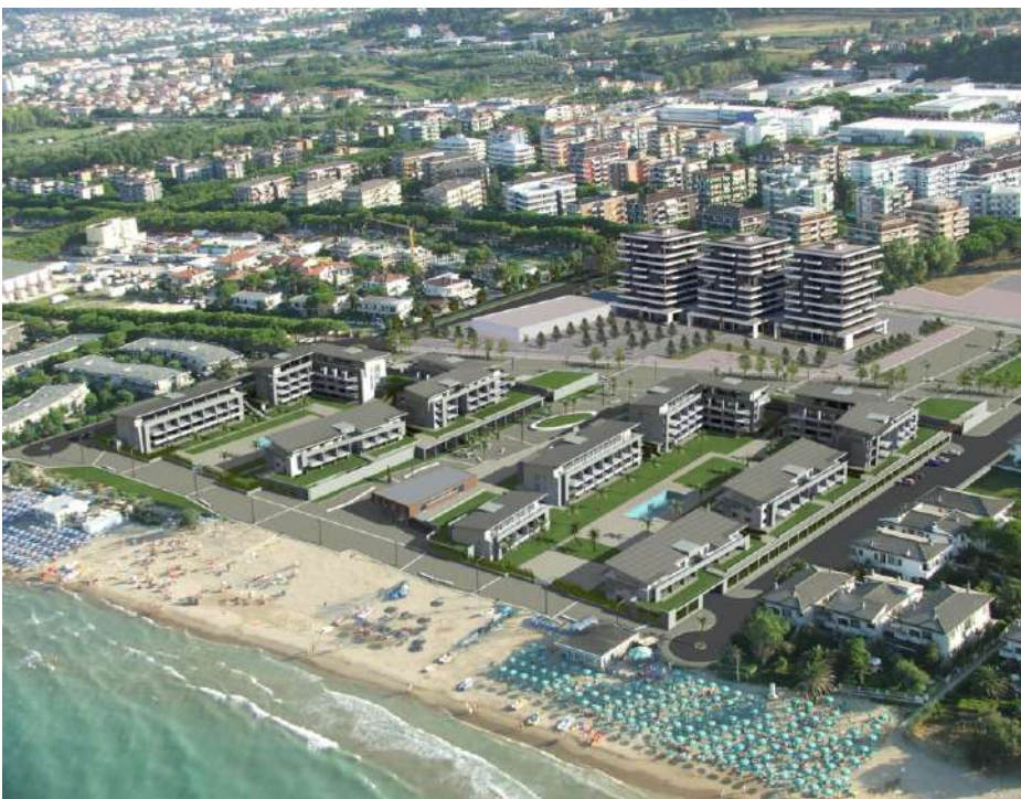
RENDERING: Veduta aerea da Nord-Est