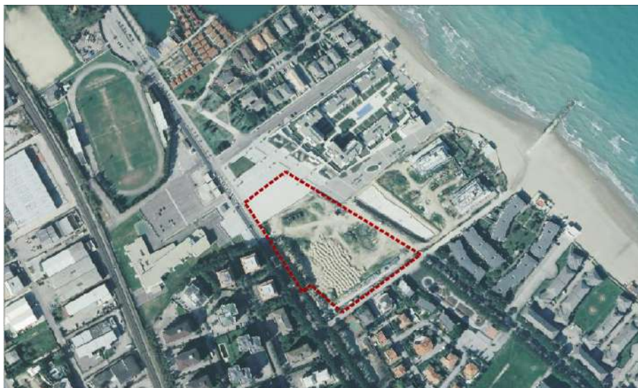
Individuazione ambito urbano oggetto di variante

La Variante al Piano di Lottizzazione di cui trattasi, interessa l'area urbana di Silvi Marina delimitata sul lato Sud/Ovest da Via Leonardo da Vinci, sul lato Nord/Ovest da Via Rubicone, sul lato Nord/Est da Via Tevere e sul lato Sud/Est da Via Adige.